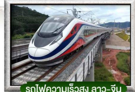
รถไฟความเร็วสูง ลาว-จีน