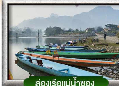
ล่องเรือแม่น้ำซอง