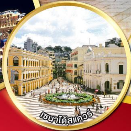
เซนต์ปีเตอส์เบิร์ก