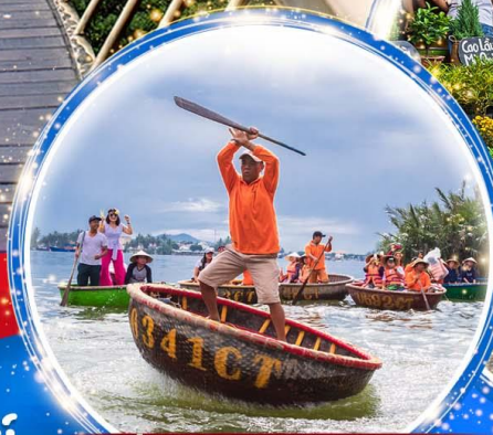
นั่งเรือกระดัง Hoi an