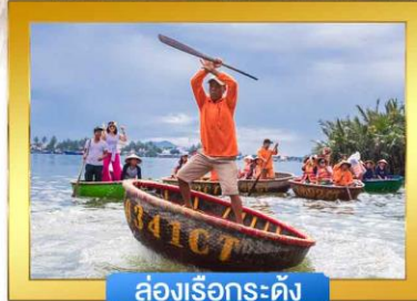
ล่องเรือกระดิง