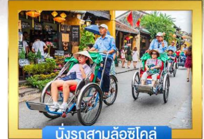
นั่งรถสามล้อซิโคล์