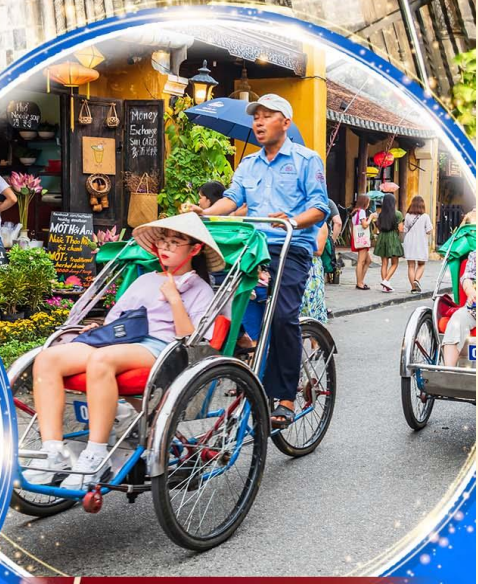
นั่งรถสามล้อซิโคล