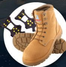
รองเท้าสำหรับเดินบนหิมะ น้ำแข็ง หรือติดก้นลื่น Ice grippers