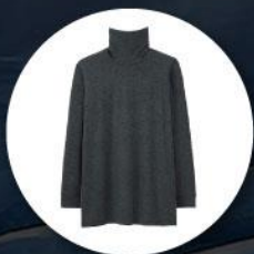
Heattech (ฮิกเทค) แบบหนาพิเศษ ทั้งกางเกงและเสื้อ

1. เสื้อผ้าควรเตรียมเสื้อผ้าสำหรับป้องกันความหนาวใช้ในอุณหภูมิต่ำสุด -40 องศาโดยประมาณ