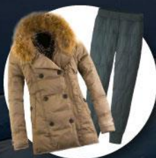
เสื้อและกางเกง กันหนาว, กันลม