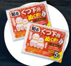
แผ่นความร้อนสำหรับ ให้ความอบอุ่นร่างกาย

2. บนเกาะโอลค์ฮอนจะมีอากาศหนาวมากต้องเตรียมกระติกน้ำเก็บความร้อนแบบพกพาได้ไปด้วย เพื่อต้มน้ำให้ความอบอุ่นร่างกาย