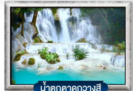
น้ำตกตาดกวางสี