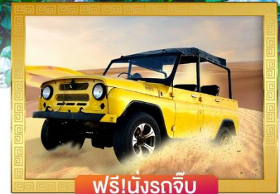
ฟรี!นั่งรถจี๊ป