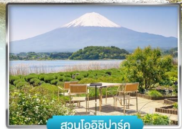
สวนโออิชิปาร์ค