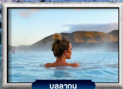
บลูลากูน