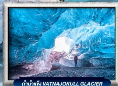
ถ้ำน้ำแข็ง VATNAJOKULL GLACIER

บินทรู สายการบิน Full Service | พิเศษ! ทานอาหารโดมกระจกิว 360 องศา