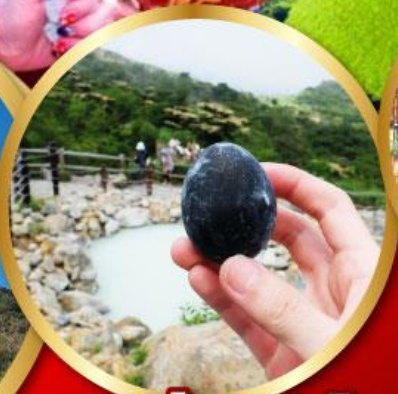
หุบเขาโอวาคูดานิ